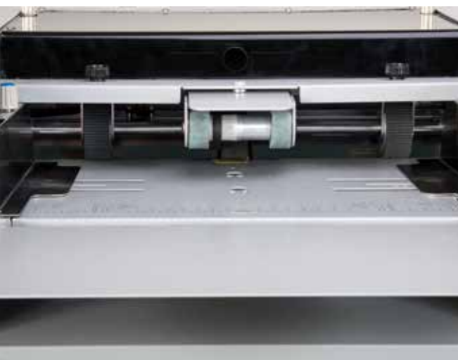
Sistema di alimentazione DMFM