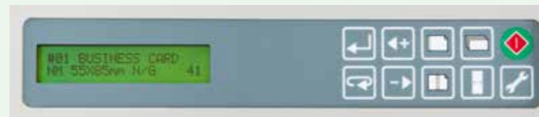
Pannello di controllo