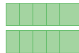
Impilatura in uscita